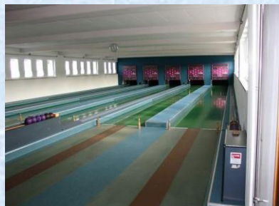
Kegelbahnen (Sport, Spaß und Spiel)