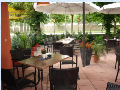
Biergarten (die Seele baumeln lassen)