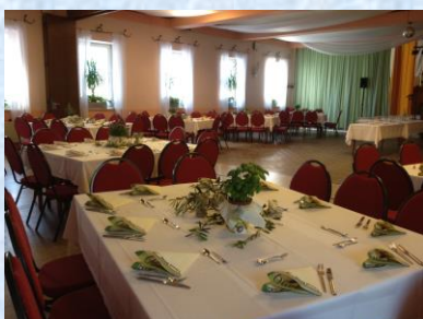
Großer Saal (für Veranstaltungen und Feiern)